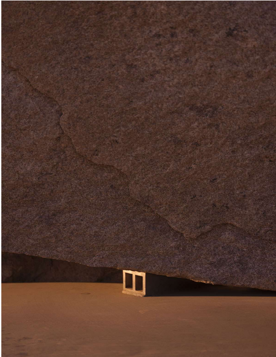
Культура уже не изолирована, а повсеместна, распространена в планетарных масштабах и ненадежна. Лос-Анджелес, 2020.

Там, где общество привыкло оглядываться на специалистов, носителей специального знания – психологов с медицинским образованием, профессиональных астрологов, эпидемиологов, музеи как вместилища культуры, – теперь имеется постоянный и неограниченный доступ как к внутреннему миру, так и к соцсетям, обеспечивающий саморефлексию и международные взаимосвязи. Культура уже не изолирована, а повсеместна, распространена в планетарных масштабах и ненадежна. Там, где мы привыкли оглядываться на институты как источники