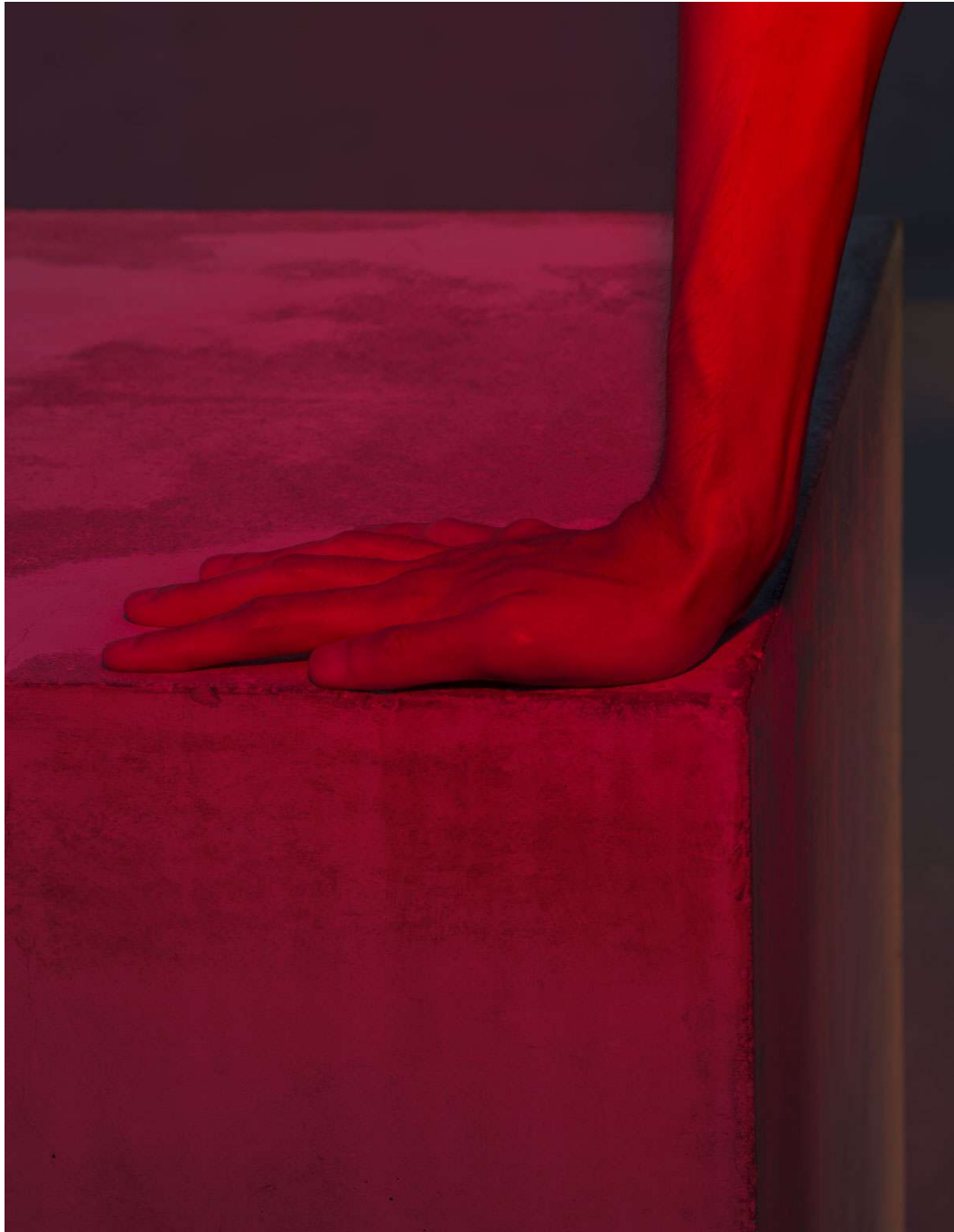
Картина мира, продиктованная одними авторитетами ради других, обречена. Лос-Анджелес, 2020.

Чем объяснить такой поворот? Почему он до сих пор не получил заслуженного признания как магистральный и знаменательный? Если ряд институций теперь старается отражать направления развития того общества, с которым себя соотносит, стремясь уловить и закрепить все более стремительно возникающие и сменяющиеся друг друга тенденции, значит, по сути они нащупывают новые основания для своей деятельности. Коллективная работа в архитектуре и дизайне, которые вроде бы по самой своей природе держатся